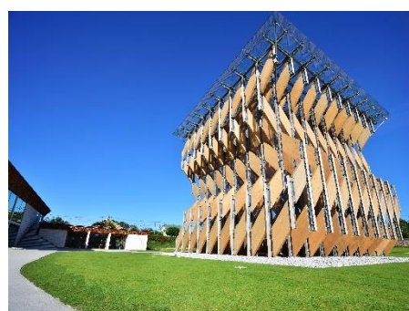
■GREENable HIRUZEN