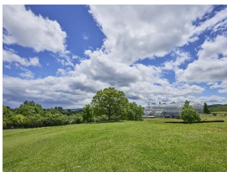
■グリーンヒルズ津山